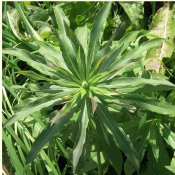
セイタカアワダチソウ